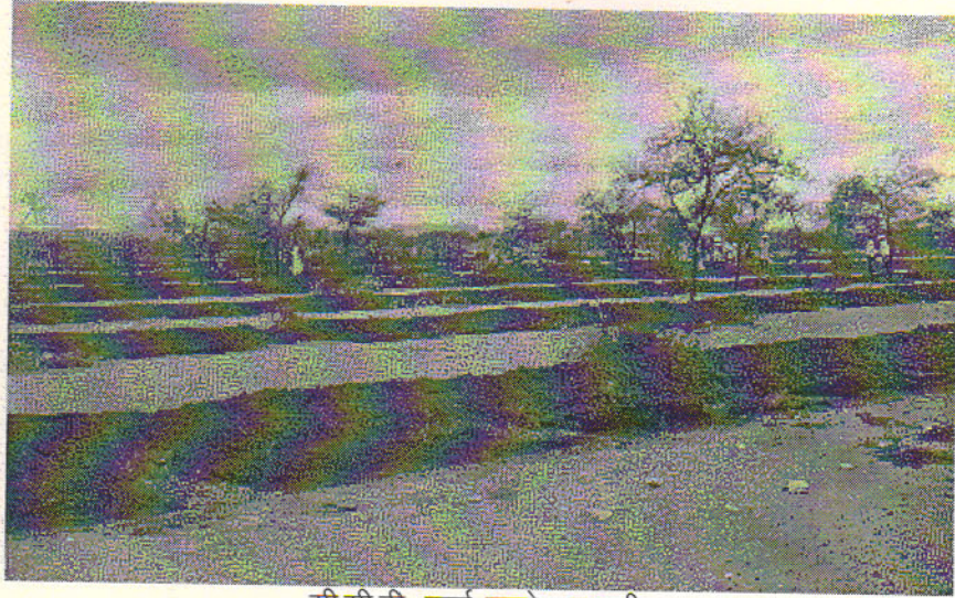
सी.सी.टी. कार्य करते सहभागी