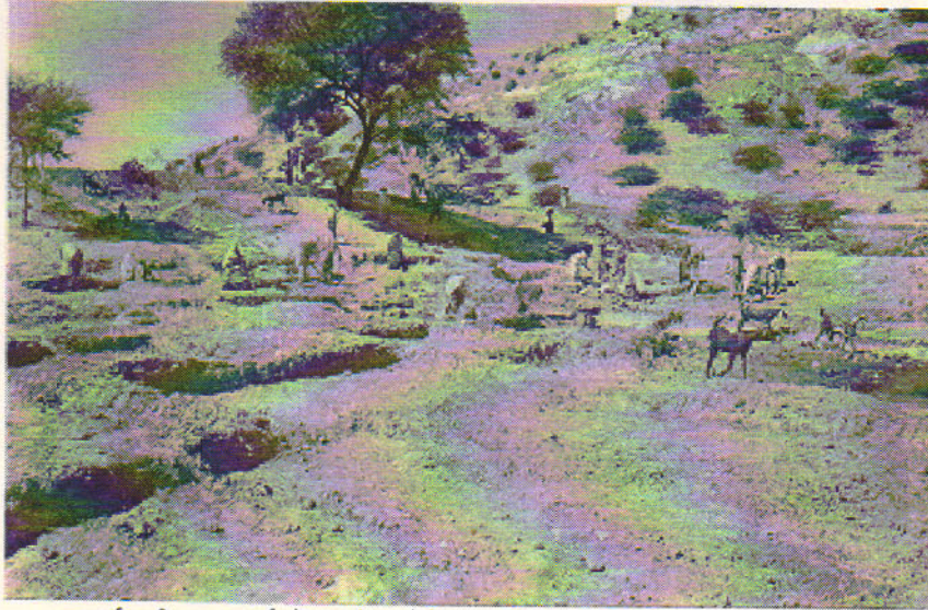
कपार्ट स्वीकृत कार्य में ढाणी पुरोहितान नाडी पर कार्य करते सहभागी