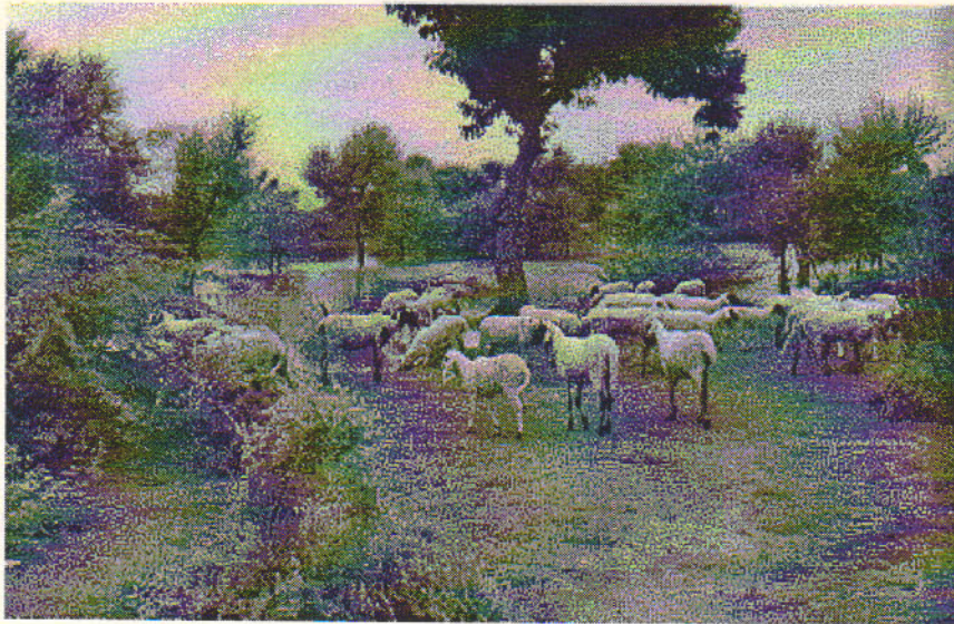
वाटरशैड निर्मित नाडी में पानी पीते पशु