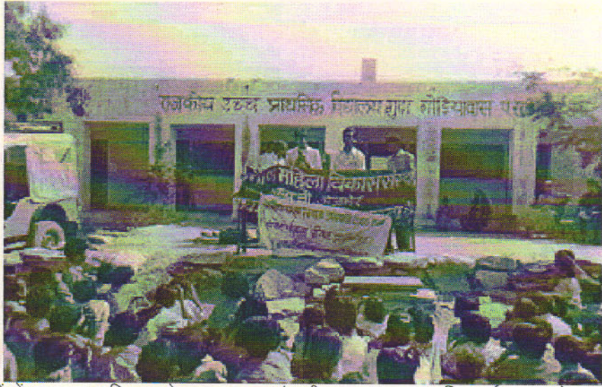
स्कूलों में स्वच्छता अभियान के तहत नाटक एवं गीत द्वारा जन जागृति कार्यक्रम करते कार्यकर्ता