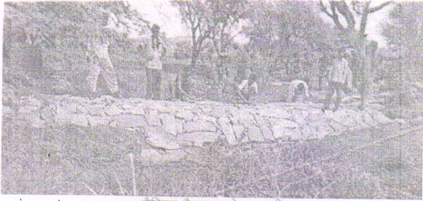
सहभागी करते तैयार गैबियन