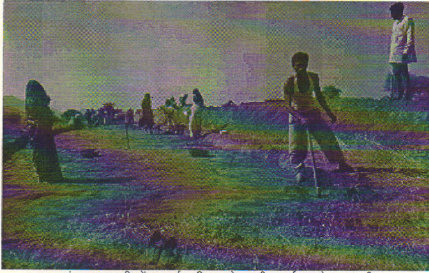
दांता -आखरी में कपाट स्वीकृत मेडबन्दी कार्य करते सहभागी