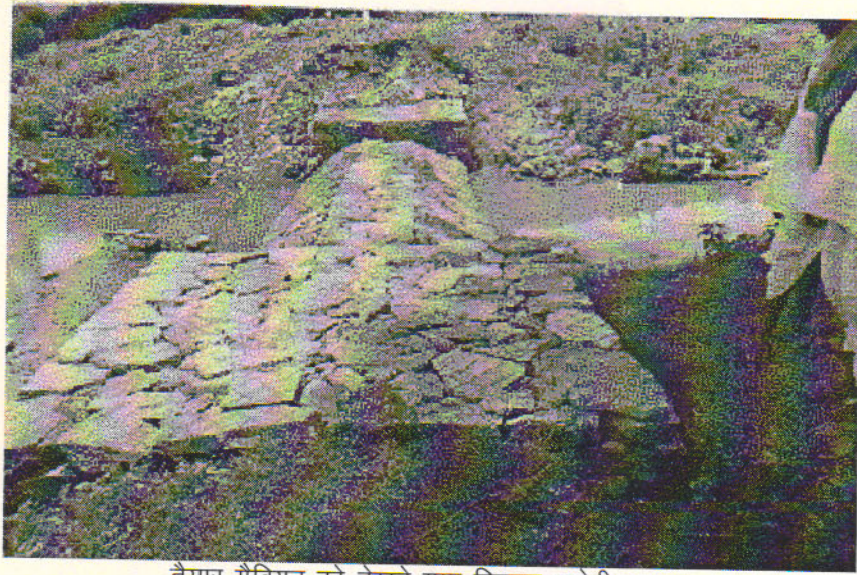
तैयार गैबियन को देखते ग्राम विकास कमेटी सदस्य

उपर्युक्त गतिविधिया बूबानी क्षेत्र में जलग्रहण योजना के तहत की गई ।