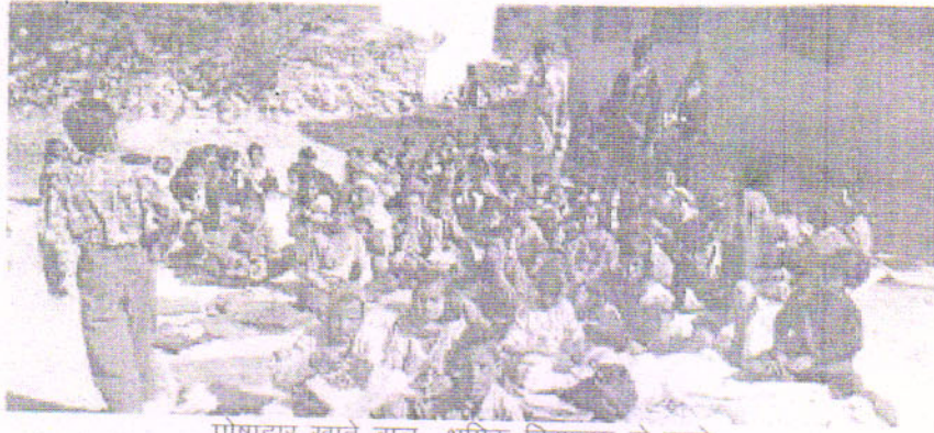
पोषाहार खाते बाल श्रमिक विद्यालय के बच्चे