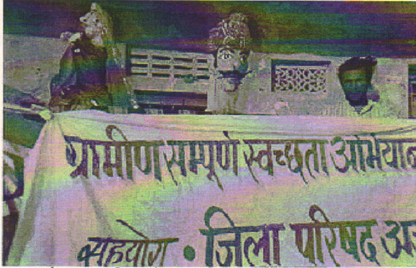
सम्पूर्ण स्वच्छता अभियान के तहत कठपूतली कार्यक्रम दिखाती संस्थान टीम